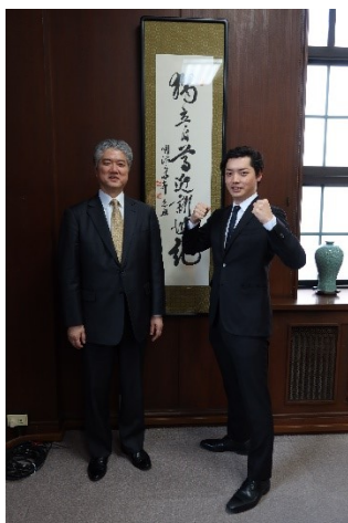
塾長と前田第3代塾生代表