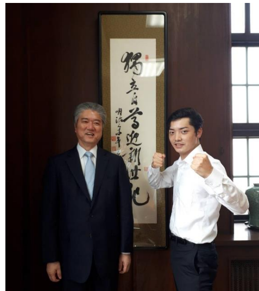
塾長と前田第3代塾生代表